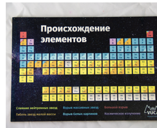
Таблица «Происхождение элементов» демонстрирует возникновение химических элементов на разных стадиях эволюции нашей Вселенной.

4 вида наборов из 10 магнитов с авторскими рисунками Байкальской природы, цветов, деревень и церквей Иркутска.